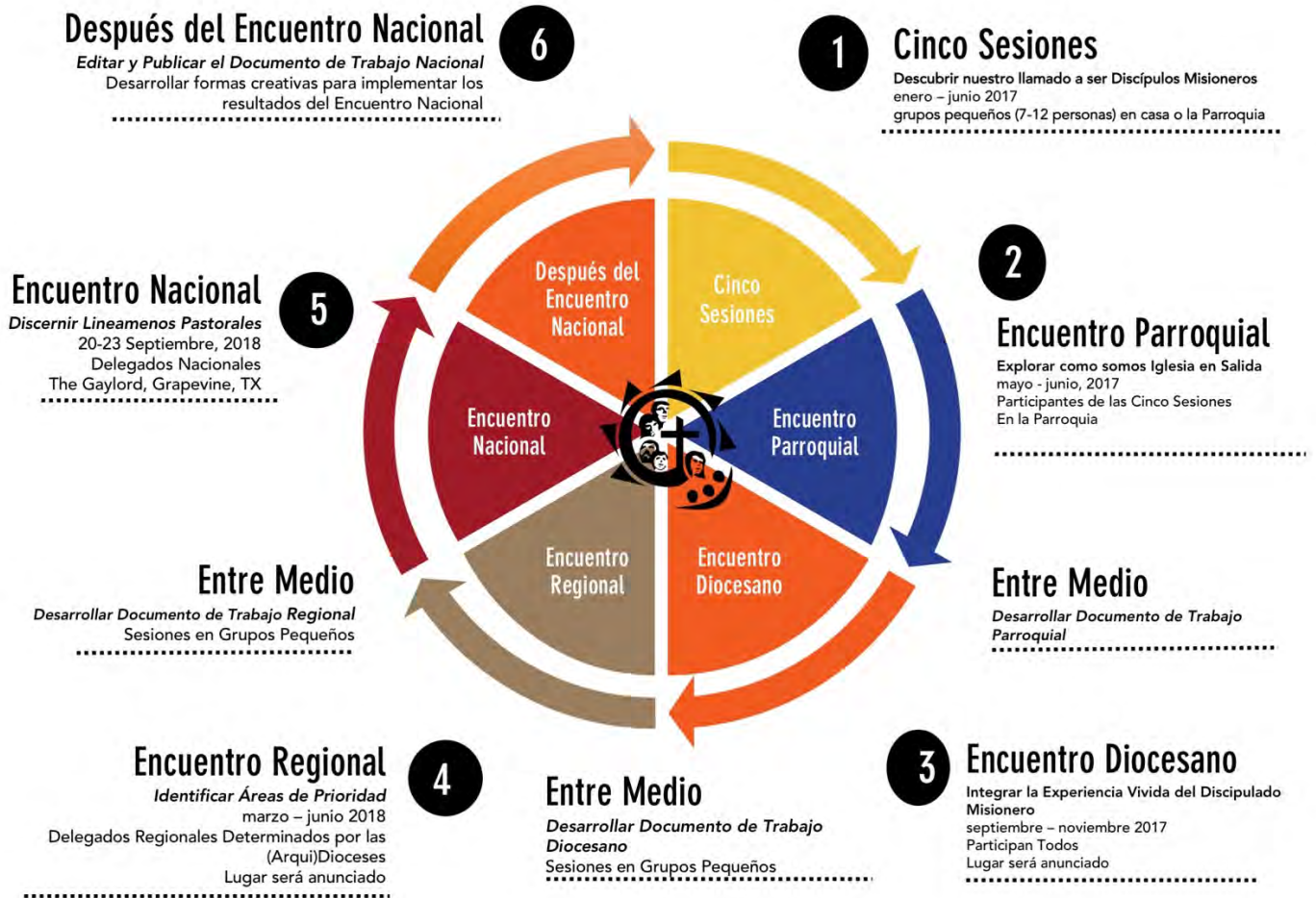
DIAGRAMA DEL PROCESO V ENCUENTRO